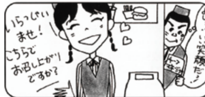
②「マネージャー向き」と「プレイヤー向き」が適性に合わせて配置できます