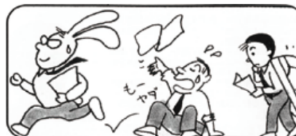
⑤「即座に効果上げる人」「時間を掛けて実績を出す人」「最後まで結果の出せない人」を判定できます