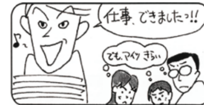
③仕事ができても「対人関係トラブル」を起こす人が判別できます