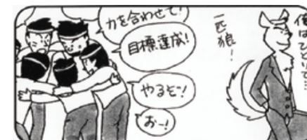
⑥「チームワークで力を発揮」するタイプと「一匹狼タイプ」を判別