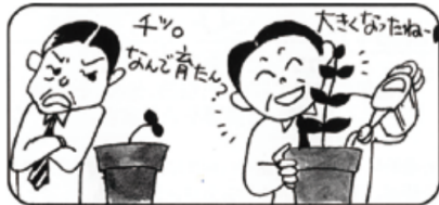
①同一の研修カリキュラムでも「育つ人材」と「育たない人材」の理由が解ります