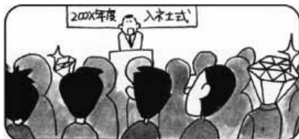
④入社時、或るいはキャリアの浅い時点でも幹部候補は見抜け、早くから育成できます